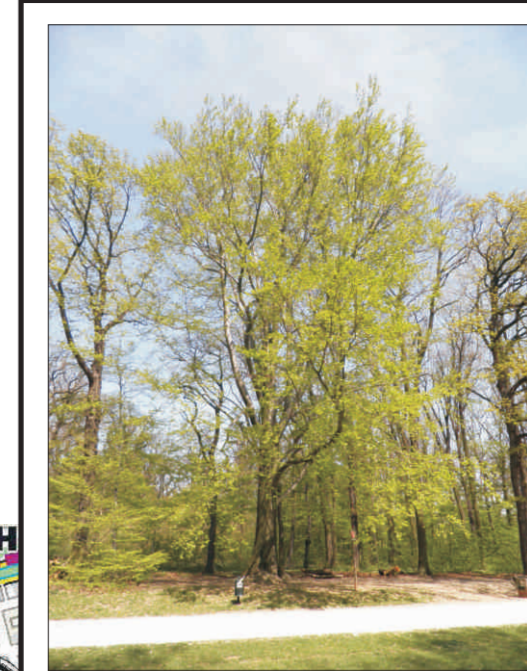
Buk lesní v oboře Hvězda o. 373 cm, v. 34 m