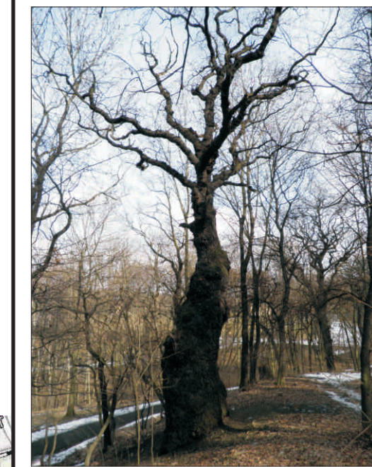
Dub s bizardním kmenem Na Cibulkách o. 525 cm, v. 17 m