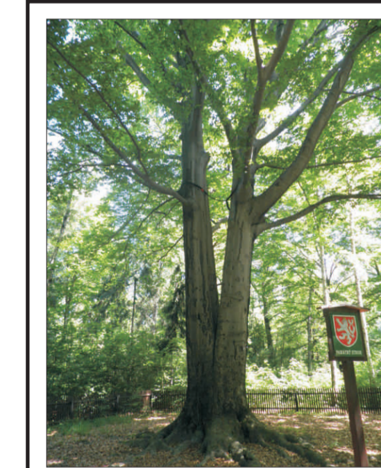
Buk lesní v oboře Hvězda o. 507 cm, v. 45 m