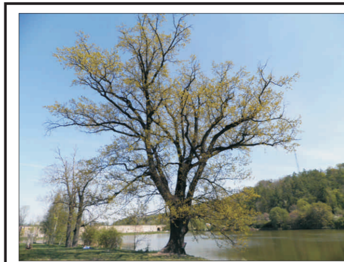
Dub letní na hrázi Libockého rybníka o. 400 cm, v. 18 m