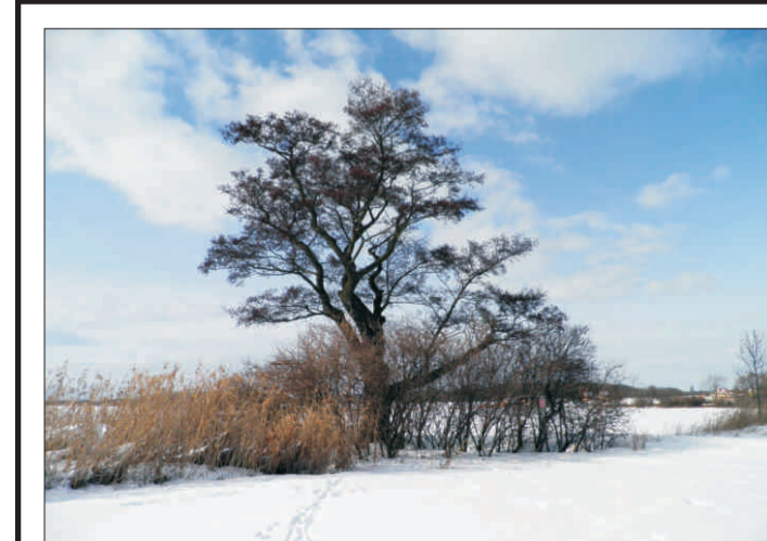
Olše lepkavá v Sobíně - i o. 282 cm, v. 13,5 m