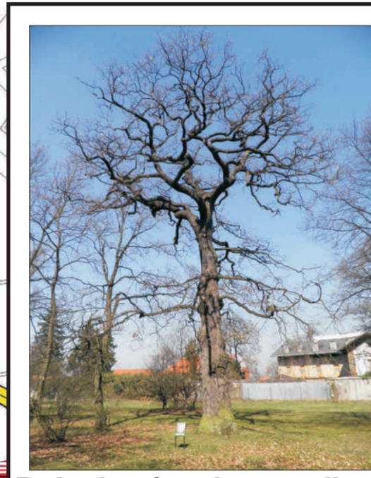
Dub zimní nad sz spojkou ve Hvězdě o. 352 cm, v. 22 m