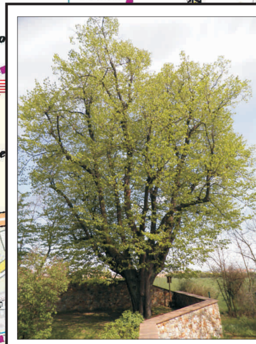
Lipa srdčitá v Chabech - i o. 665 cm, v. 21 m