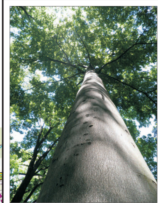
Buk proti Ruzyňské bráně o. 322 cm, v. 39 m