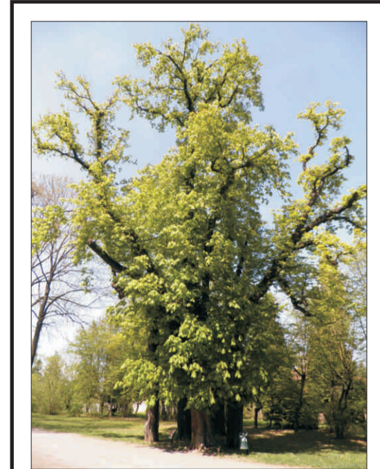
Skupina jírovce maďalu - obora Hvězda p. 5, o. 202-297 cm, v. 20 m