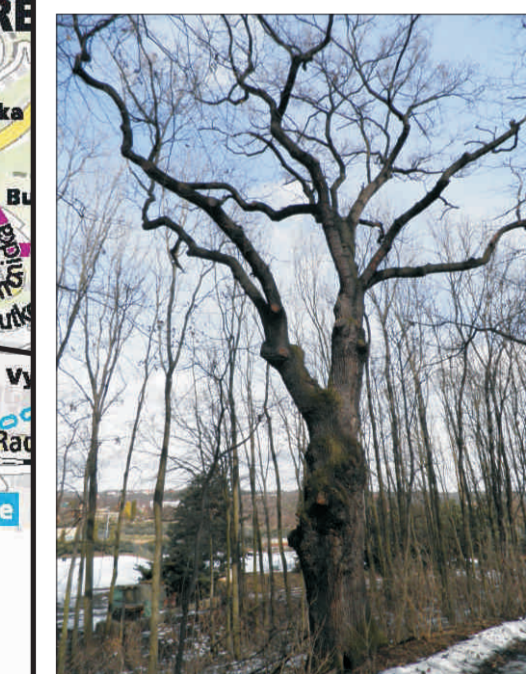
Duby v lesoparku Na Cibulkách p. 3, o. 338-504 cm, v. 16-18 m

Délka trasy: 28 km, počet památných stromů: 18 jedinců