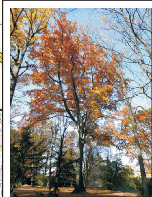
Buk lesní při zs spoje v oboře Hvězda o. 385 cm, v. 33 m