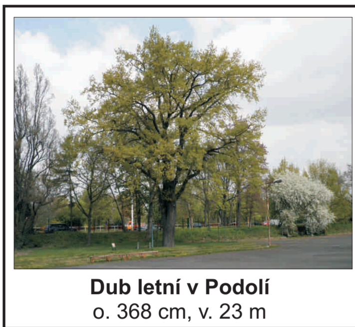
Dub letní v Podolí o. 368 cm, v. 23 m