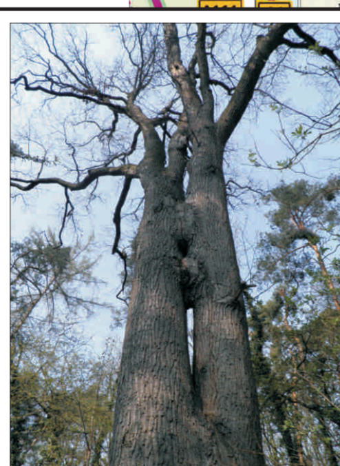
Dub v lesním porostu Kamýk o. 333 cm, v. 36 m