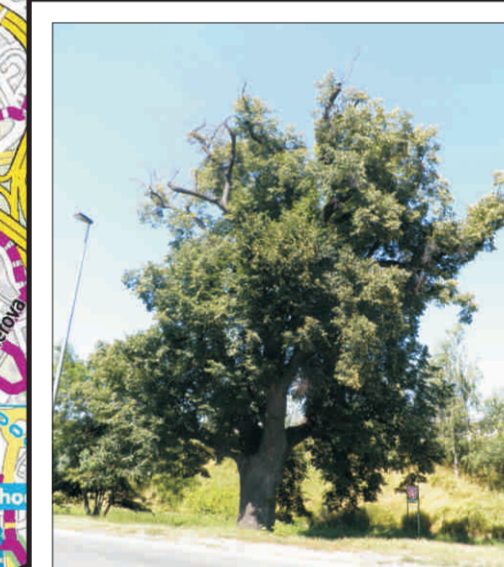
Lipa srdčitá na Videňské o. 347 cm, v. 16 m