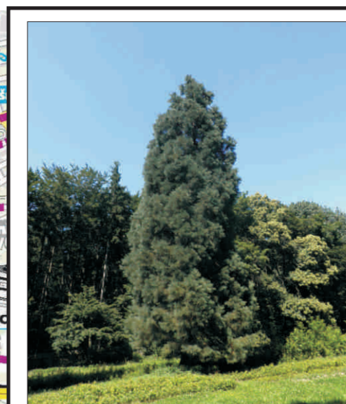
Sekvojovce obrovské v Michelském lese p. 2, o. 340, 335 cm v. 34,5; 35 m