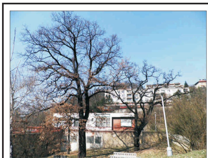
Duby v ulici Mezivrší p. 3, o. 237-324 cm, v. 21-26 m