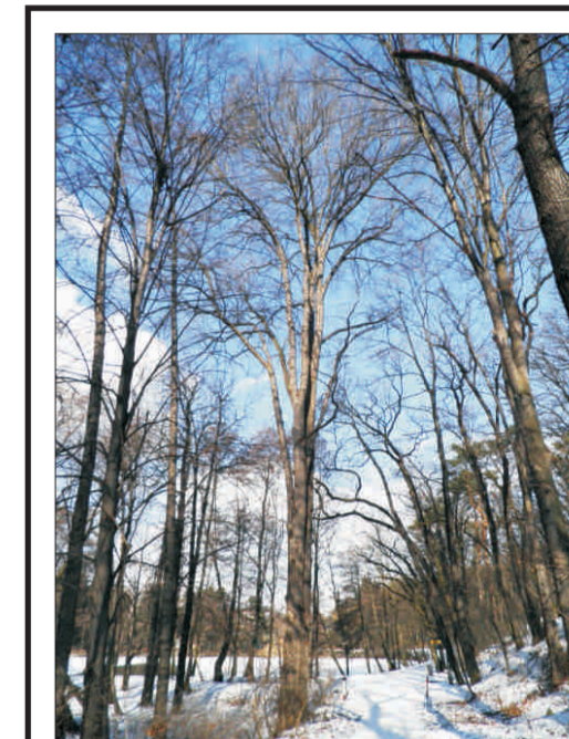
Jilm vaz v Michelském lese o. 358 cm, v. 31 m