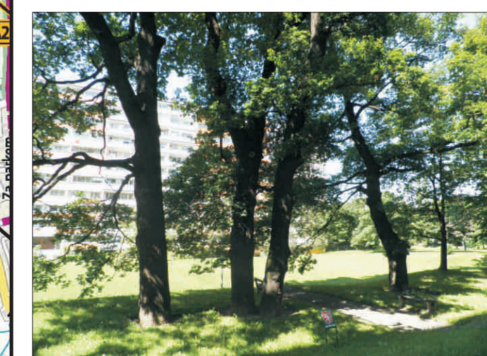
Skupina dubů v ulici Sládkovičova p. 4, o. 216-272 cm, v. 21-26 m

Podrobný popis trasy je umístěn na webových stránkách www.prazskestromy.cz