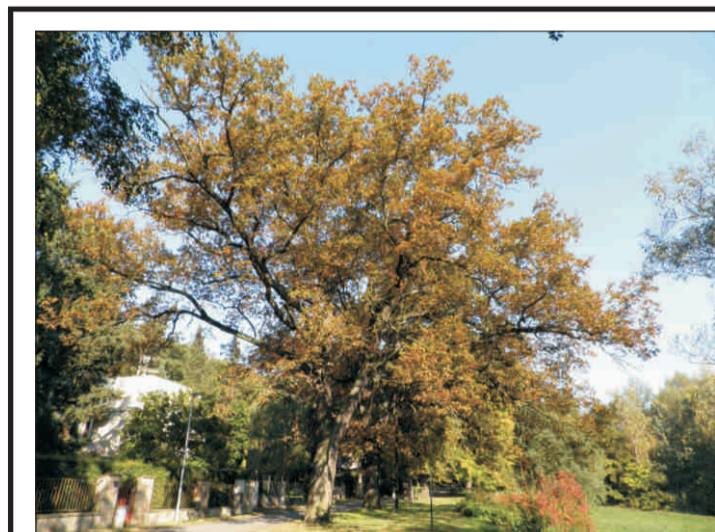
Stromořadí dubů letních v Hodkovičkách - i p. 12, o. 262-403 cm, v. 18-32 m