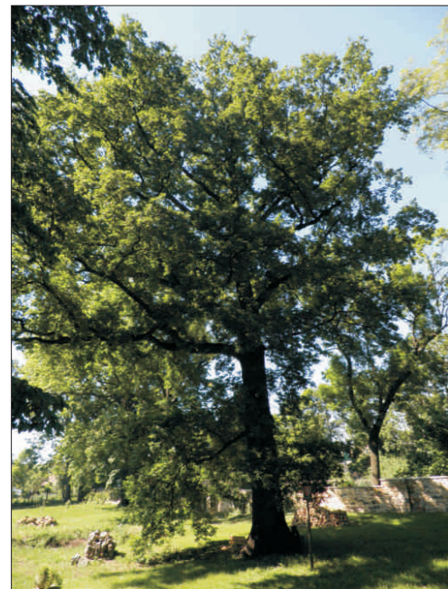
Dub letní v Dolních Chabrech o. 370 cm, v. 34 m