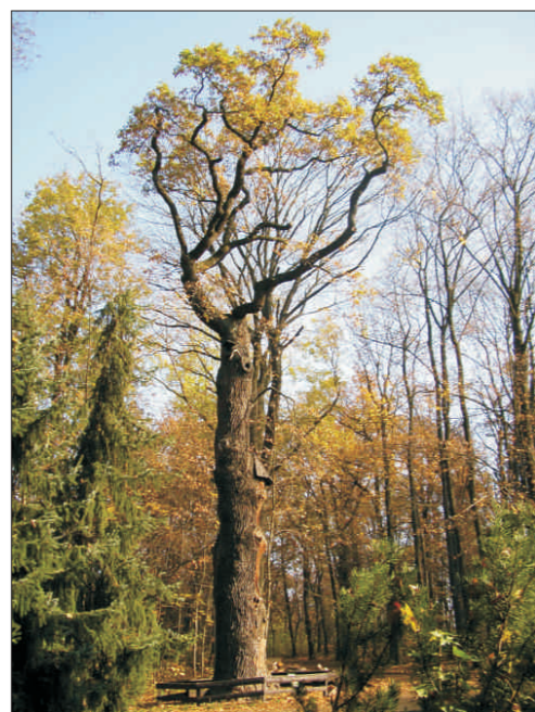
Dub letní u hájovny v Čimickém háji - i o. 493 cm, v. 19 m