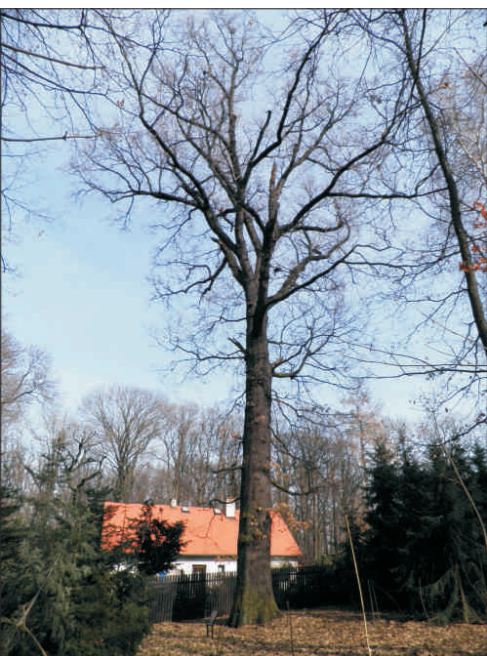
Dub letní za hájovnou v Čimickém háji o. 362 cm, v. 32 m