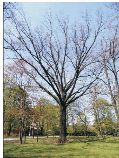
Dub letní při ulici Střelnická o. 400 cm, v. 27 m